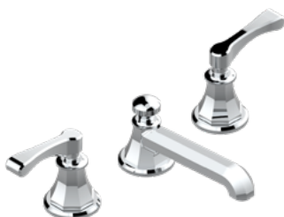
A55.151 Mezclador bimando para lavabo 3 orificios - manettes