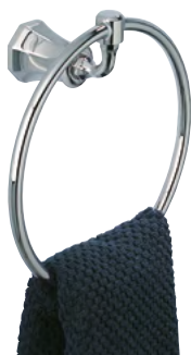
A54.504N Toallero de anilla