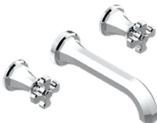
A54.415G Mezclador bimando para baño 3 orificios mural