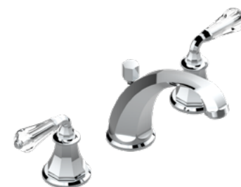
A56.152 Mezclador bimando para lavabo 3 orificios sobre placa - caño alto / cristal à manettes