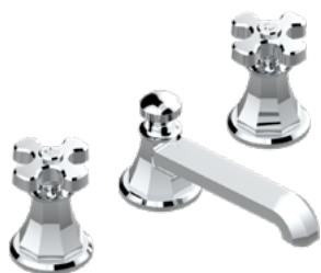
A54.151 Mezclador bimando para lavabo 3 orificios - croisillons