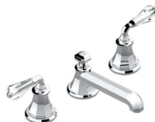
A56.151 Mezclador bimando para lavabo 3 orificios - cristal à manettes