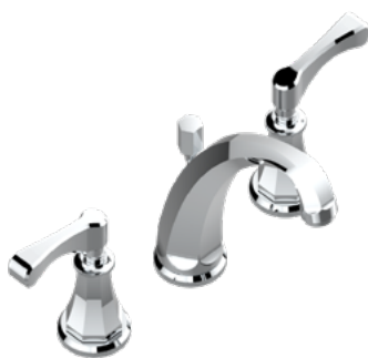
A55.152 Mezclador bimando para lavabo 3 orificios sobre placa - caño alto / manettes