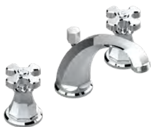
A54.152 Mezclador bimando para lavabo 3 orificios sobre placa - caño alto / croisillons