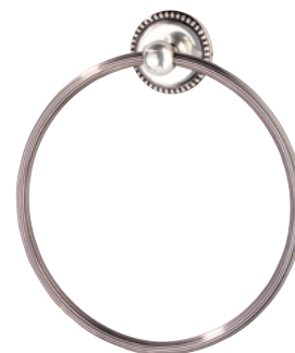
G14.504N Держатель для полотенец в виде кольца