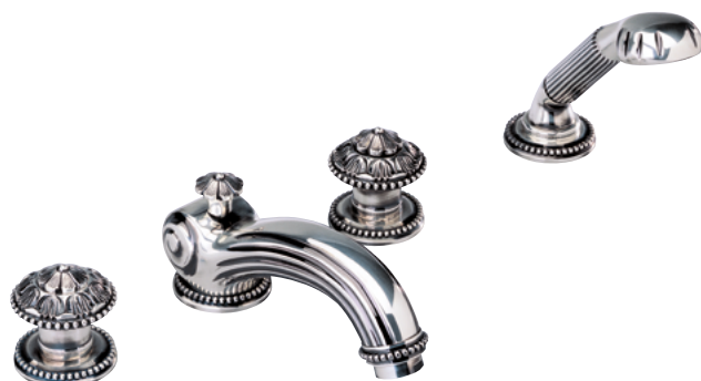
G14.112BG Смеситель для ванны и душа на 4 отверстия