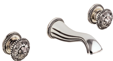
G14.40G Настенный смеситель для раковины на 3 отверстия