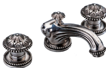
G14.151 Смеситель для раковины на 3 отверстия