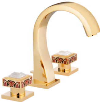
A2S.151 3孔台盆混合龙头 Solaire