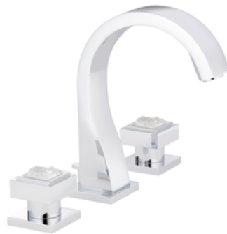
A2U.151 3孔台盆混合龙头 M étal lisse