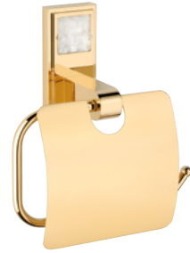
A2T.538AC 手纸架 M étal gravé