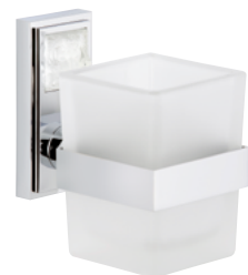
A2U.536 杯架 M étal lisse