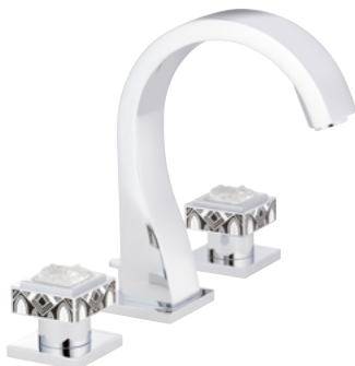
A2R.151 3孔台盆混合龙头 Lunaire