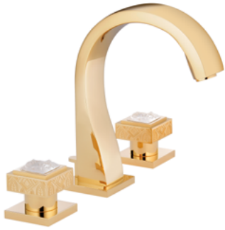
A2T.151 3孔台盆混合龙头 M étal gravé