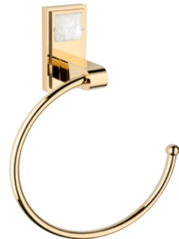
A2T.504N 毛巾环 M étal gravé