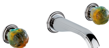
U5A.40G Настенный смеситель для раковины на 3 отверстия