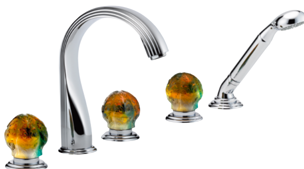
U5A.1132SG Смеситель для ванны с ручным душем, оснащенный прогрессивным смесителем