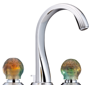
U5A.151 Смеситель для раковины на 3 отверстия