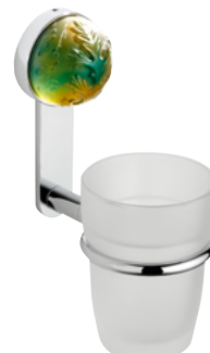
U5A.536 Держатель для стакана