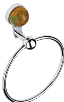
U5A.504N Держатель для полотенец в виде кольца