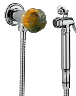
U5A.5840/8 Гигиенический комплект