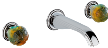
U5A.40G 入墙式3孔台盆混合龙头