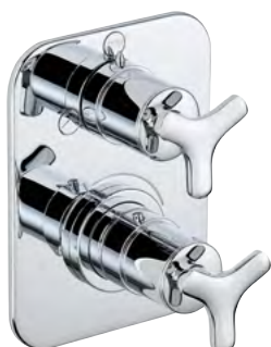
G7F.5500BE Adorno para mezclador monomando termostático