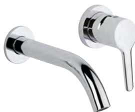
G7F.6541 Mezclador monomando para lavabo