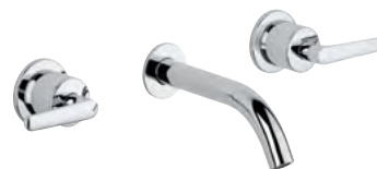
G7G.41SG Mezclador bimando para baño 3 orificios