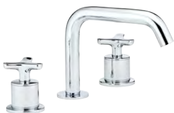
G7F.151 Mezclador bimando para lavabo 3 orificios