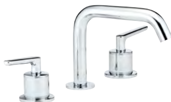
G7G.151 Mezclador bimando para lavabo 3 orificios