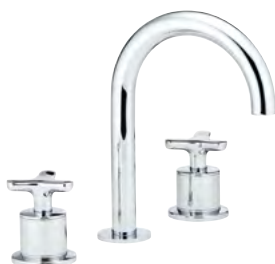
G7F.152 Mezclador bimando para lavabo 3 orificios sobre placa - caño alto