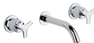
G7F.41SG Mezclador bimando para baño 3 orificios