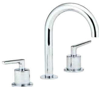
G7G.152 Mezclador bimando para lavabo 3 orificios sobre placa - caño alto