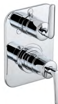
G7G.5500BE Adorno para mezclador monomando termostático